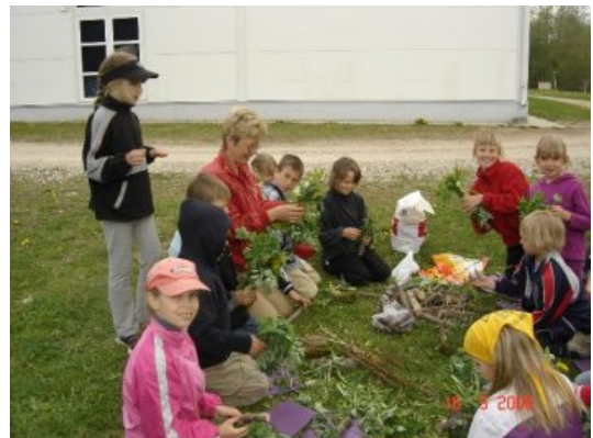
Meisterdamine looduslikust materjalist