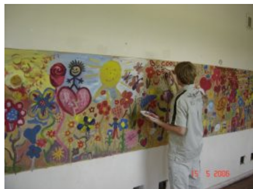
Kogu kooli kunstiprojekt “ Värvikarussell”