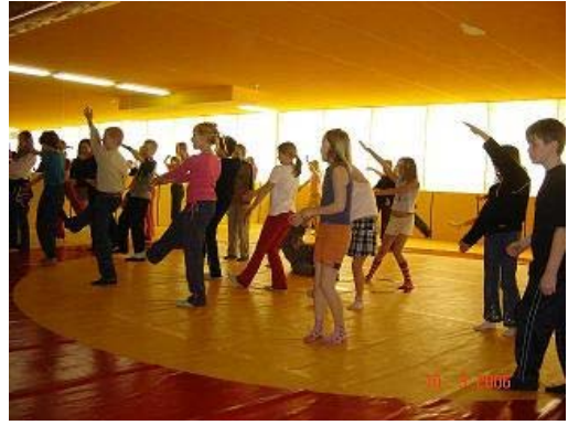
Talvine tantsulaager Suure-Jaanis