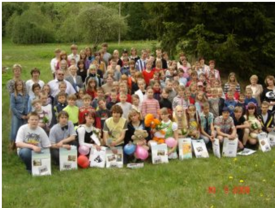
Kogu koolipere ja õpetajad 2006. aasta kevadel