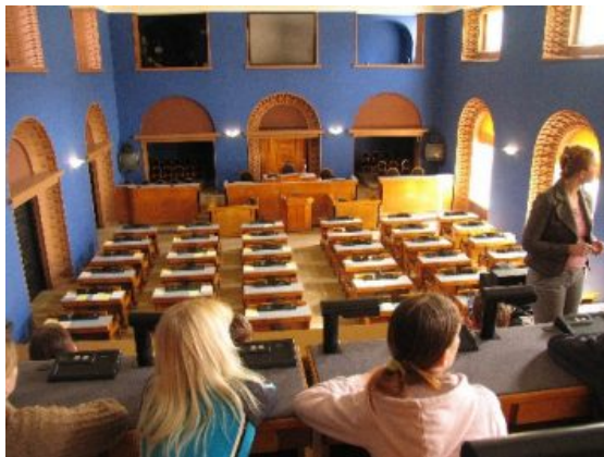
Südamenädala raames käidi Tallinnas Riigikogus ja Okupatsioonimuuseumis

Kevadel ja sügisel korrastatakse kooliümbrust