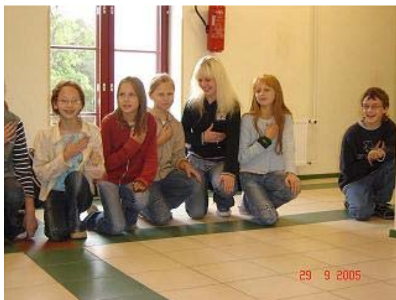
Mihklipäeval toimus traditsiooniline "oinapäev" – 5. klassi suurte hulka lugemine

Õpilaste ühistööna valmis kooliaeda Täaksi loodus-ajaloolise õpperaja stand