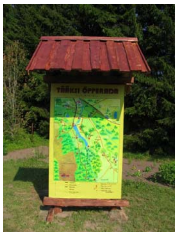
Õpilaste ühistöö – õpperaja stend kooliaias

Koolimaja ees kasvav tamm on istutatud samal aastal, mil koolimaja valmis – aastal 1931