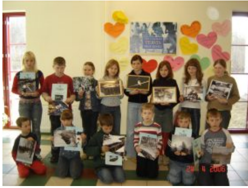
Fotokonkursi "Tere, talv" võitjad