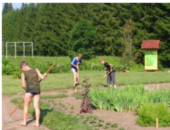
Suvine aiatöö kooliaias