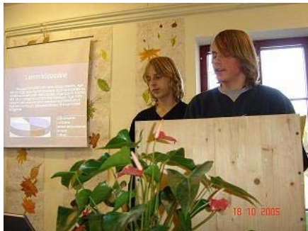
Ajalookonverents vabariigi aastapäeval