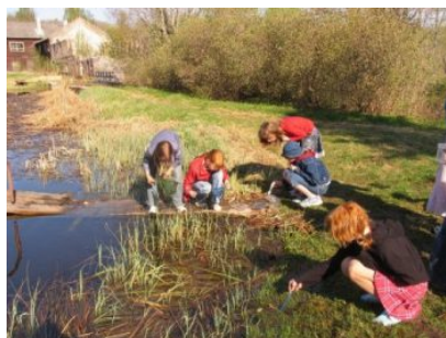
Vee-elustiku tund Täaksi järve ääres