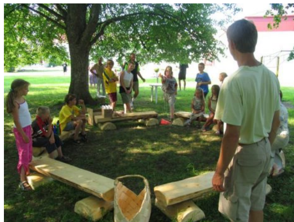
Õueklass koolimaja ees pärnaringis