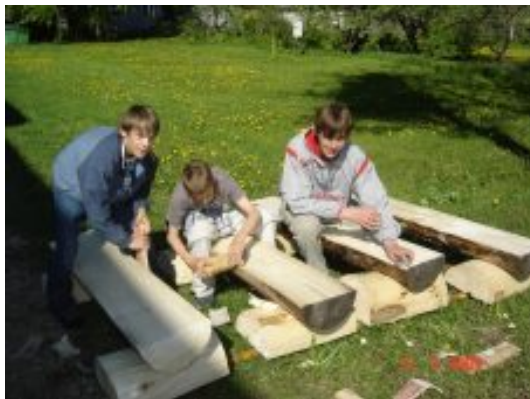
Õueklassi pinkide valmistamine